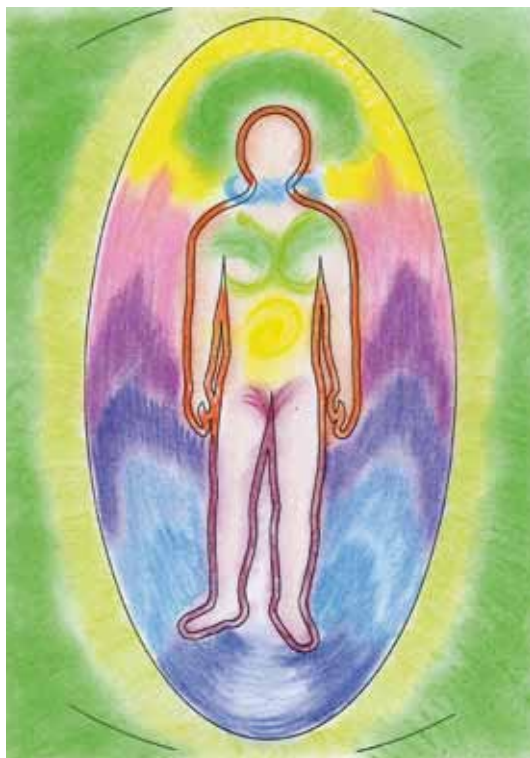
Abb. 46 Aura eines gesunden Menschen

Die Möglichkeit, dies mittels eines farbigen Auragrafs sichtbar zu machen, zählt für mich zu den Sternstunden der Heilkunst. Wir gehen selbstverständlich davon aus, dass der Simileffekt oder die Resonanz zwischen Person