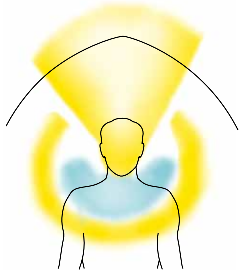
Abb. 49 Patientin nach Austritt aus dem Körper