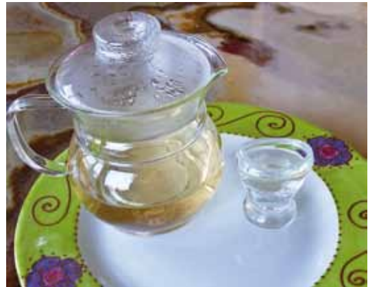
Abb. 23 Sassafras-Aufguss und Augenbadewanne

Die Wurzelrinde von Sassafras officinalis , dem nordamerikanischen Fenchelholzbaum, wurde seit dem 17. Jahrhundert bei Leberkongestionen, Magenschwäche und Nierenschwäche eingesetzt. Auch bei Haut-Skrofulose und Augen-Syphilis galt Sassafras – oft in Kombination mit Sarsaparilla, Rhus toxicodendron oder Guajacum – als bewährtes Heilmittel, um das Blut zu reinigen und den Schweiß aus den Poren zu treiben. Ich lernte die Augenspülung