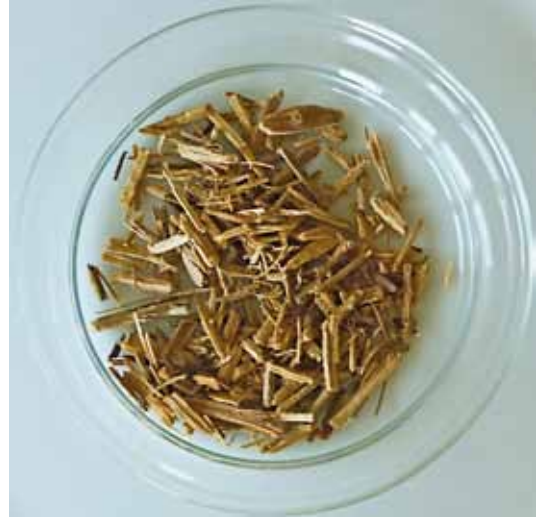
Abb. 22 Sassafras-Holz